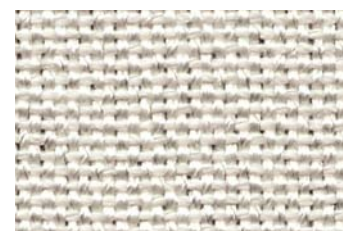
KlevoSil Texo 770 V4A-1 L

Nous sommes à votre disposition pour vous conseiller. Nous fabriquons sur demande toute réalisation non standard.