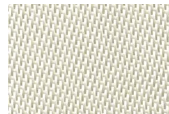
KlevoGlass 2002-1 A