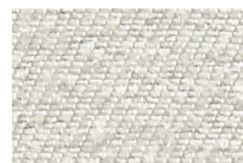
KlevoGlass Itex 400-1 K