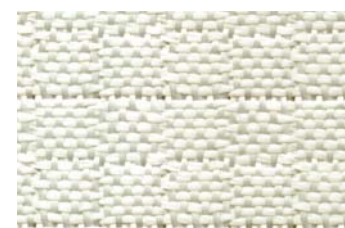
KlevoGlass 630-1 Karo