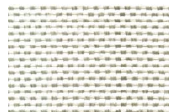
KlevoGlass Texo 656-1 L