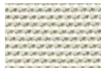
KlevoGlass Texo 2000-1 DG