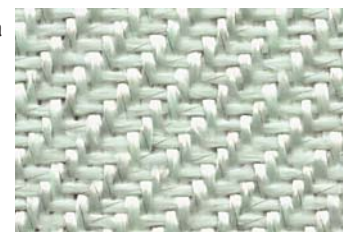
KlevoGlass HtexPlus 790 V4A-1 K